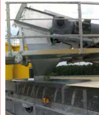
Niet bindend, wijzigingen onder voorbehoud Versie 2017 / 1.1

Trechters, overstortpunten na zeefinstallatie, stortgoten, overstortpunten van transportbanden, uitlopen van wastrommels en morskranen voor bandtransporteurs, etc.